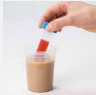
Merítés vagy kenet