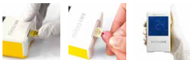
Sätt i testchipet