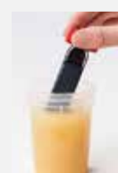
Ponoriť, pritlačiť alebo zotrieť